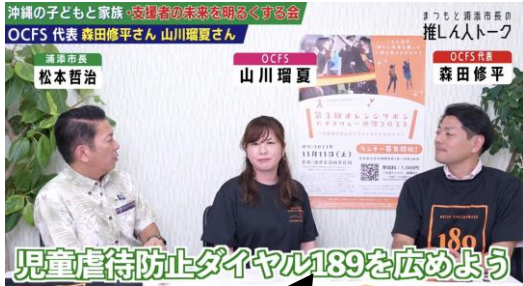
まつもと浦添市長の推し人トーク放送