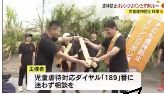
沖縄テレビ (R5.11.11土) 放送