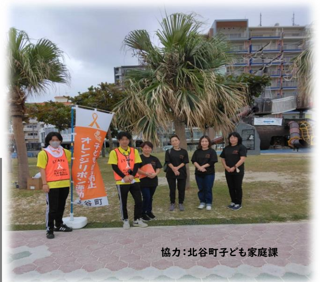
協力：北谷町子ども家庭課