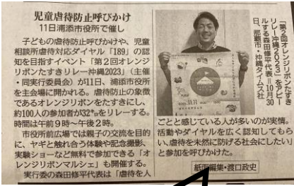
沖縄タイムス (R5.11.5日) 掲載