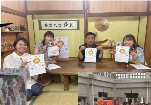
あまくま歩人: OCN ~イベント告知~