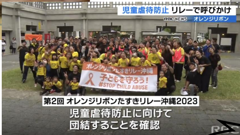
琉球放送 (R5.11.17金) 放送