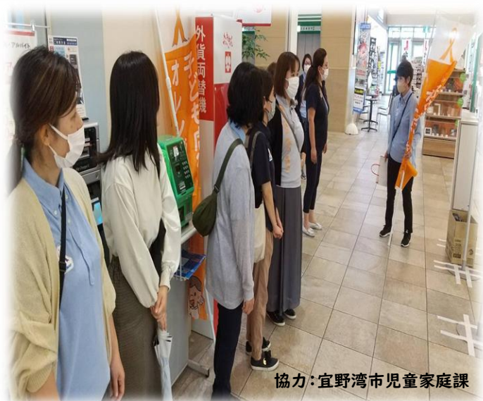
協力：宜野湾市児童家庭課