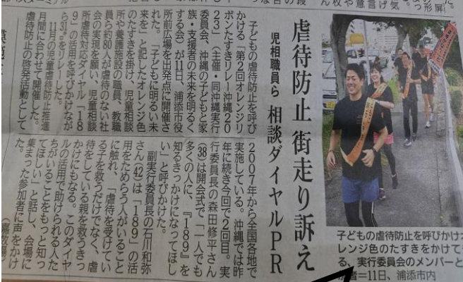
琉球新報 (R5.11.12日) 掲載