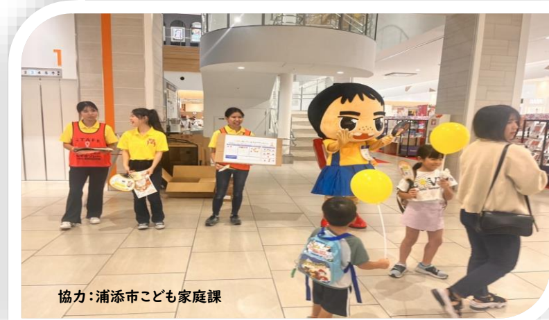
協力：浦添市子ども家庭課