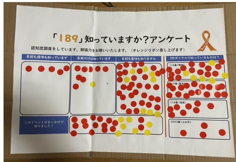
※上図：「189」認知度調査アンケート表の一部（参考） ※下図：浦添市役所での調査実施状況（参考）