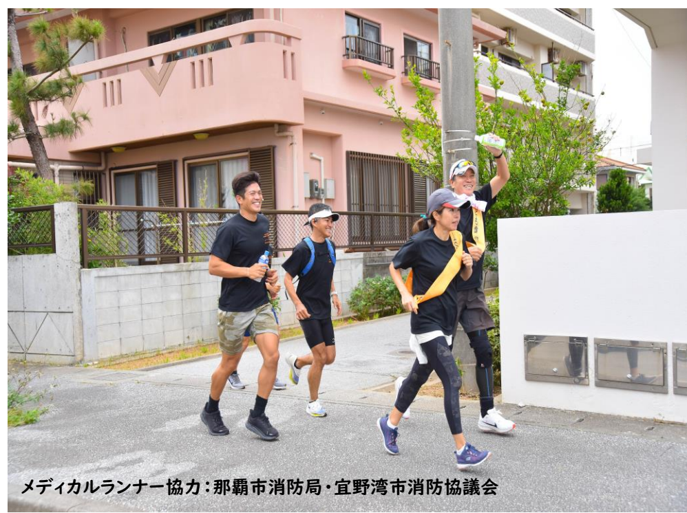
メディカルランナー協力：那覇市消防局・宜野湾市消防協議会