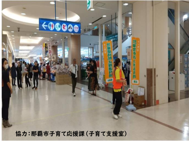
協力：那覇市子育て応援課（子育て支援室）