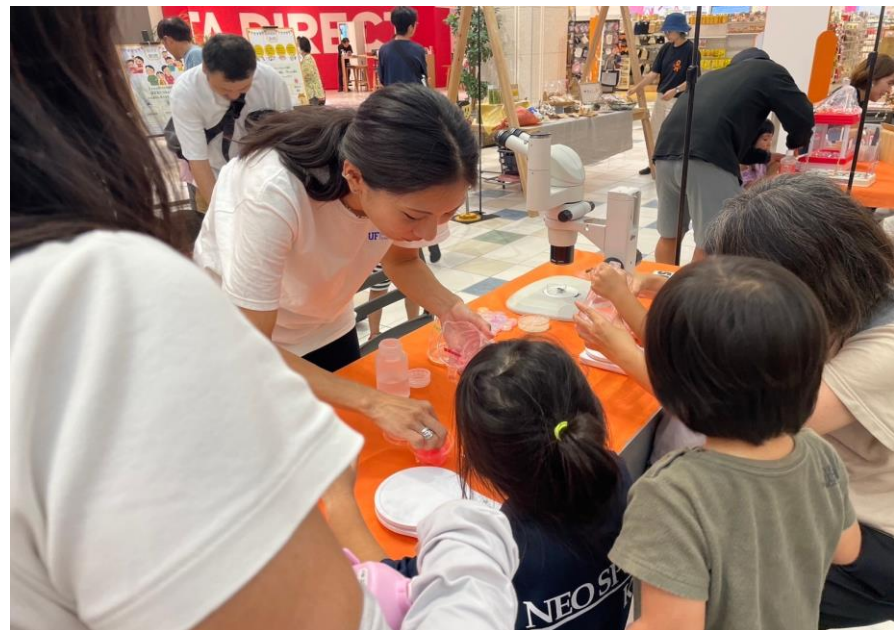
体験ブース（atelier me（キッズネイル体験））