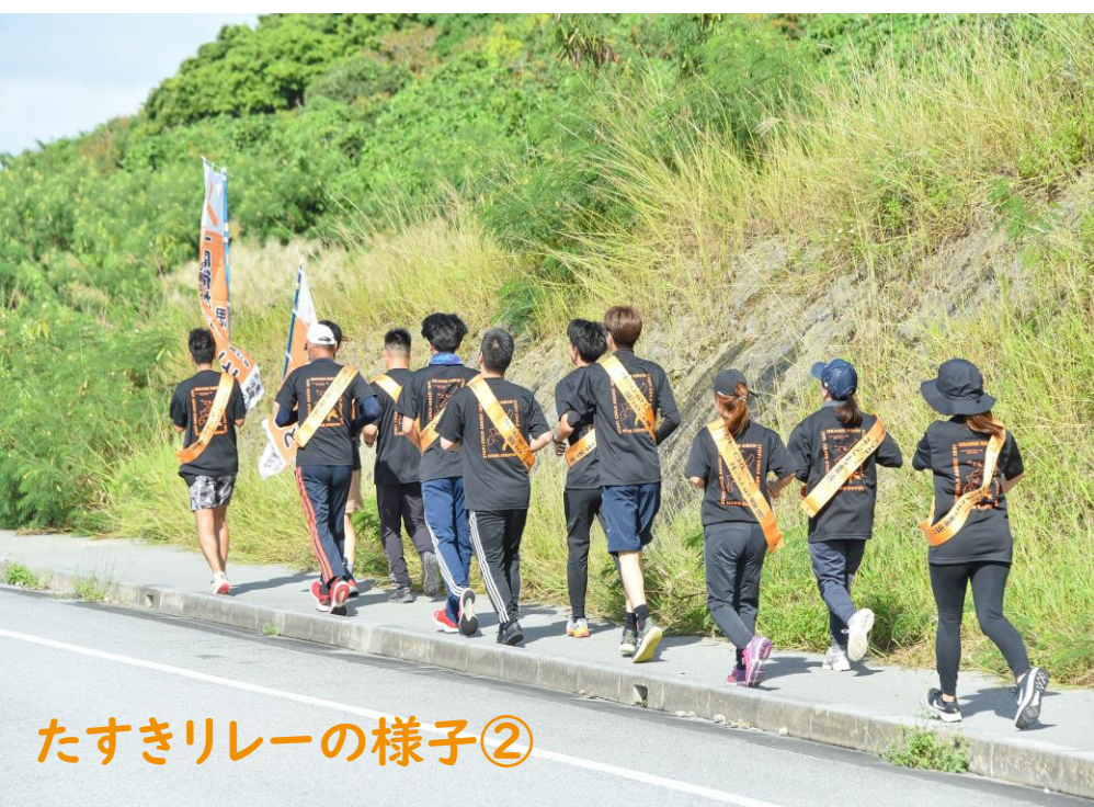
たすきリレーの様子②