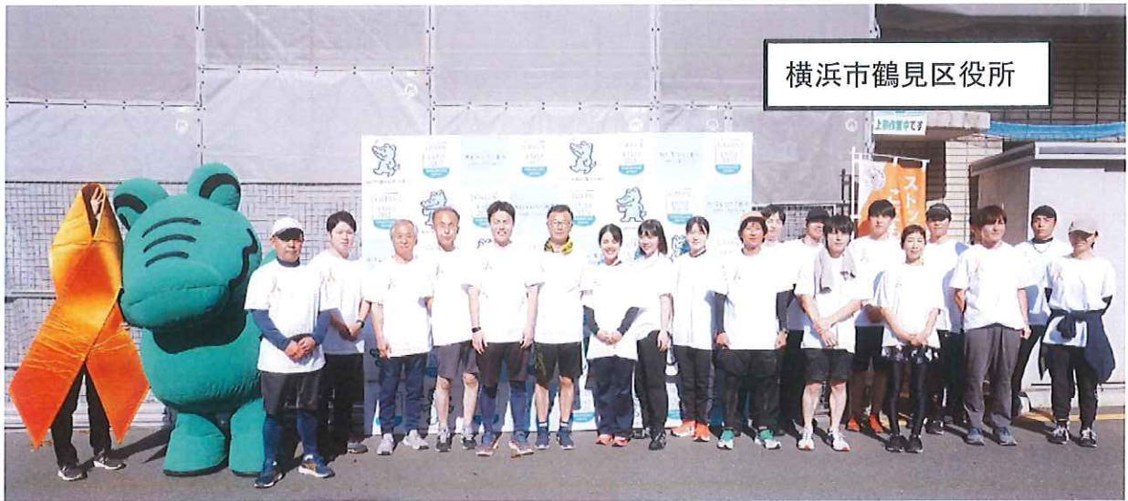
横浜市鶴見区役所