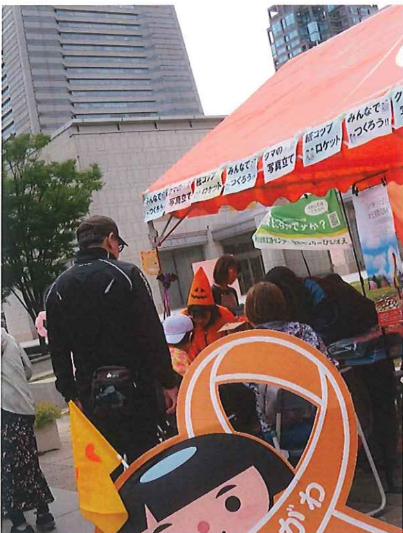
子ども虐待防止神奈川キャンペーン 神奈川県