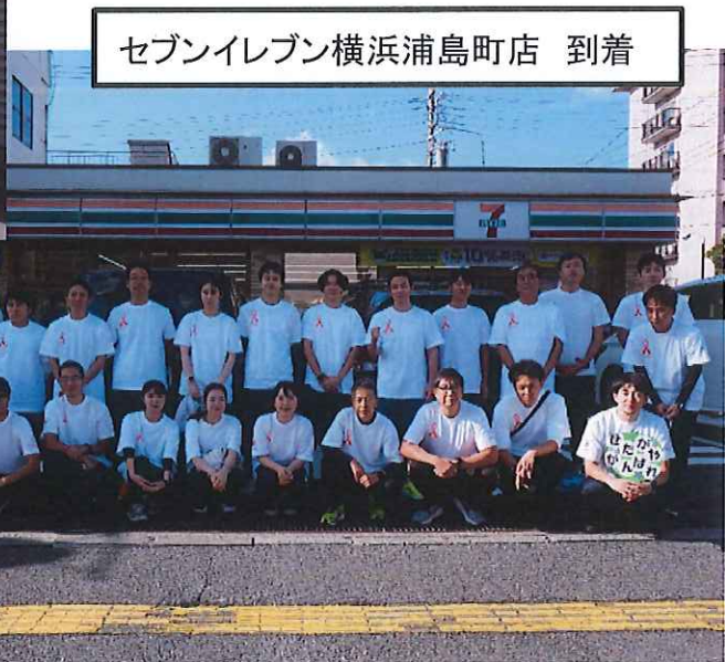
セブンイレブン横浜浦島町店 到着