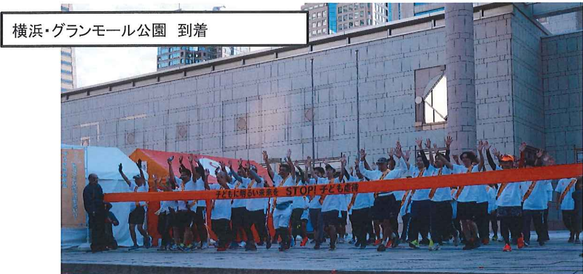
横浜・グランモール公園 到着