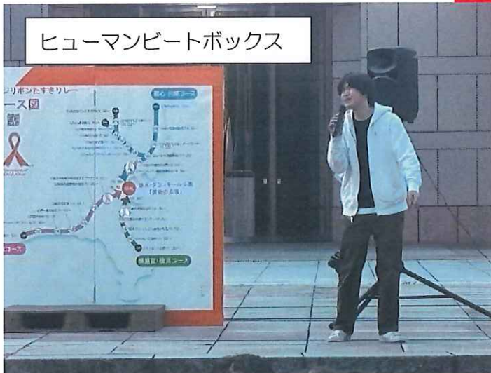
ヒューマンビートボックス