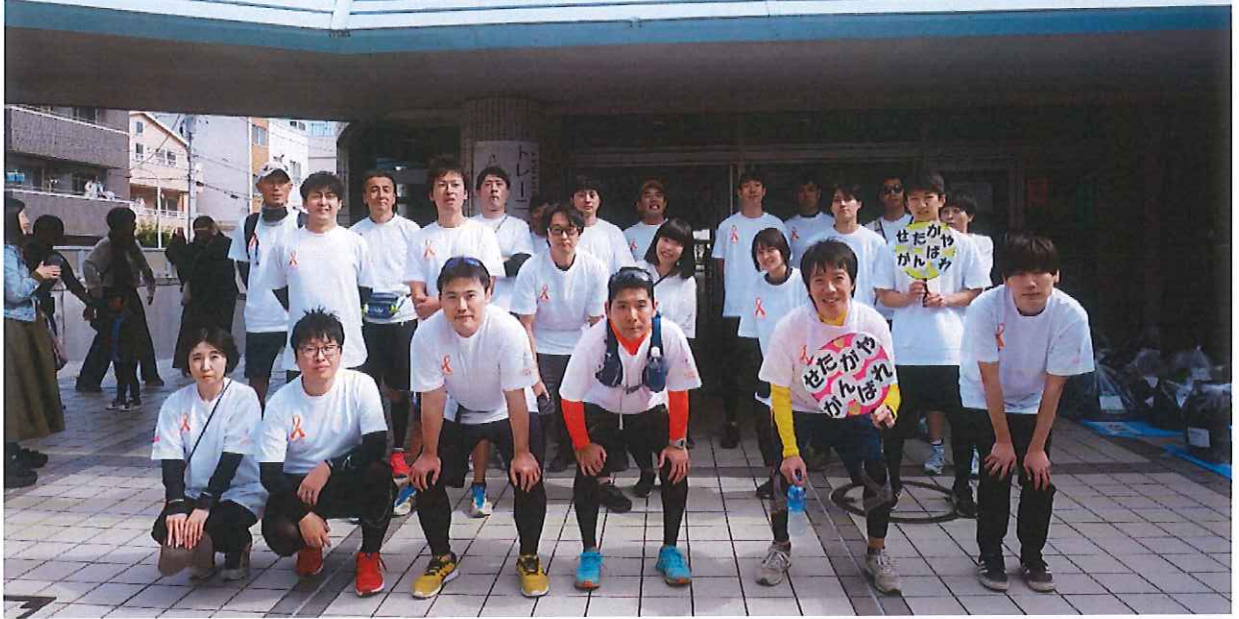
大田区立大森スポーツセンター