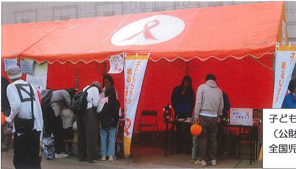
子どもの未来のために (公財) 資生堂子ども財団 全国児童家庭支援センター協議会