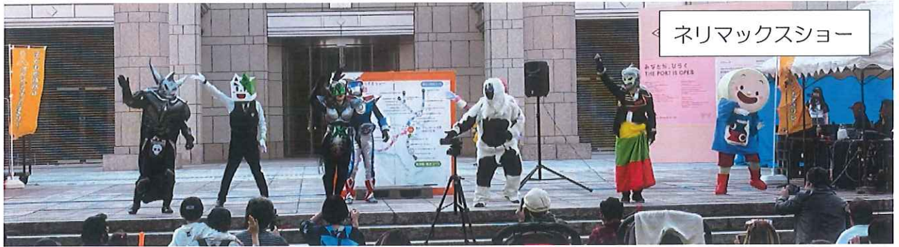
ネリマックスショー