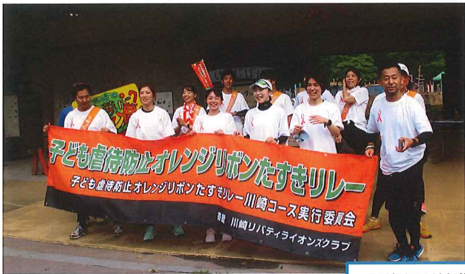
川崎市子ども夢パーク 到着