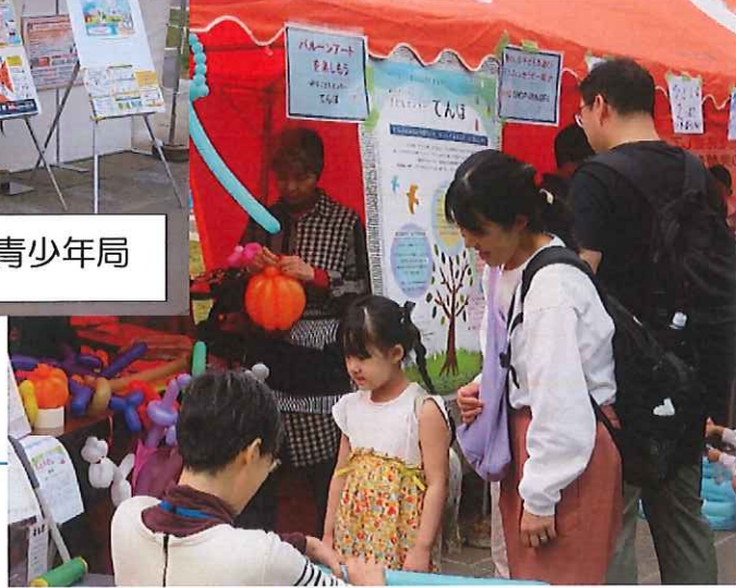
バルーンアートを楽しもう NPO 子どもセンターてんぼ