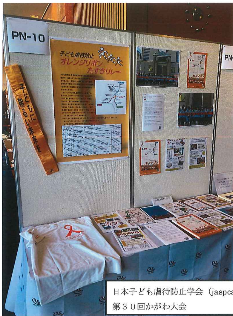
日本子ども虐待防止学会 (jaspcan) 第30回かがわ大会