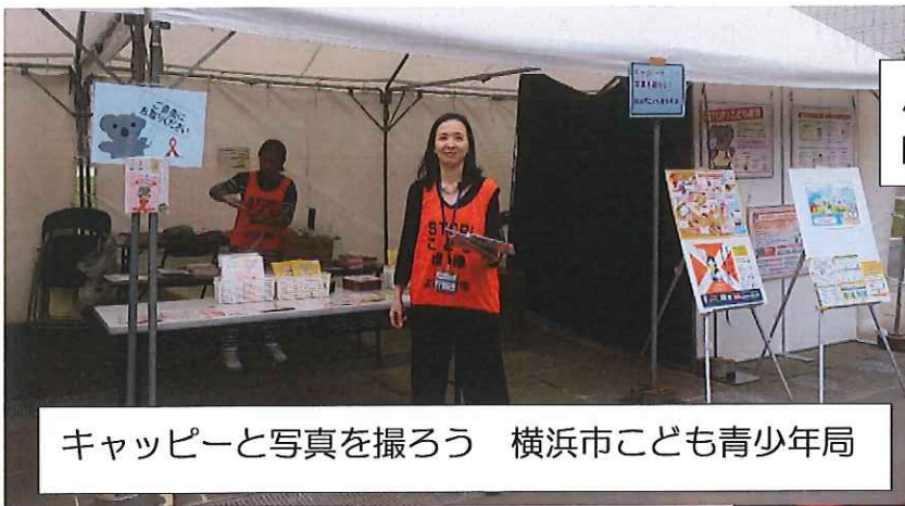
キャッピーと写真を撮ろう 横浜市こども青少年局