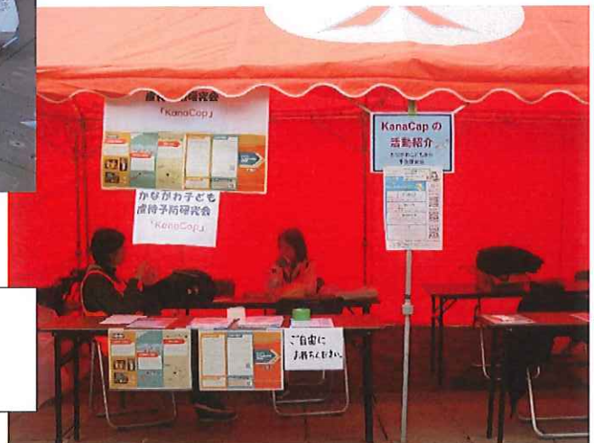
KanaCap の活動紹介 かながわ子ども虐待予防研究会