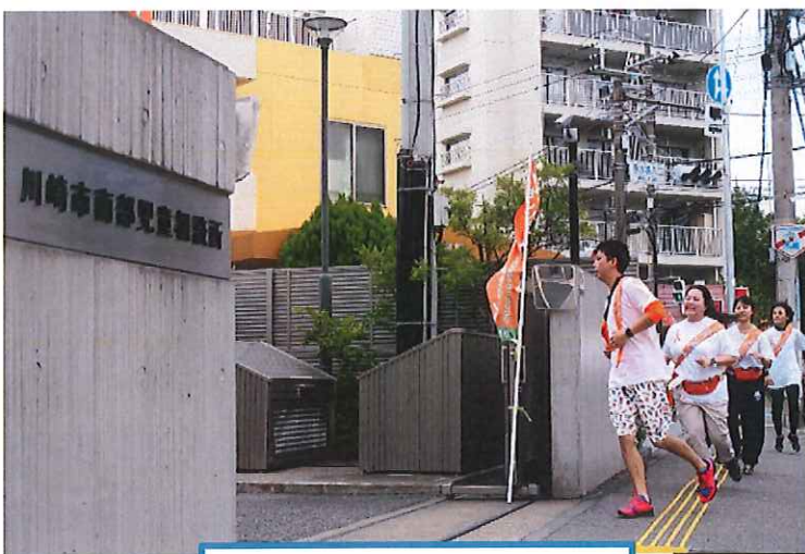
川崎市南部児童相談所