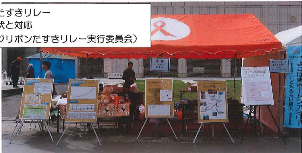
オレンジリボンたすきリレー 子ども虐待の現状と対応 本部 (オレンジリボンたすきリレー実行委員会)