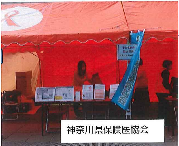
神奈川県保険医協会