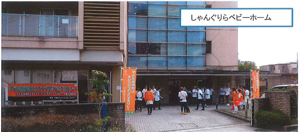
しゃんぐりらベビーホーム