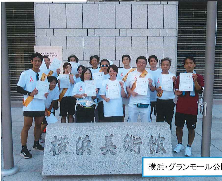
横浜・グランモール公園 到着