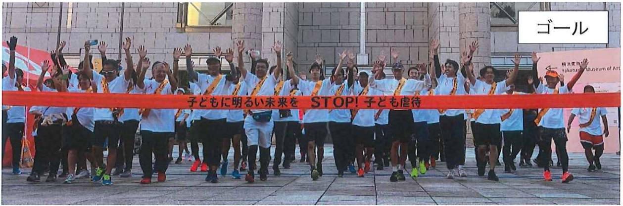
万歳、万歳、実行委員長