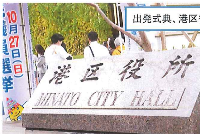
出発式典、港区役所