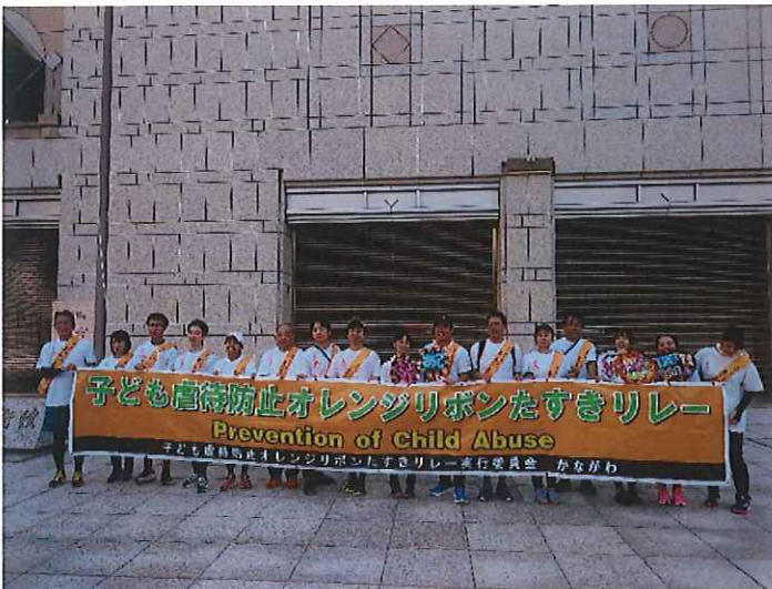
横浜・グランモール公園 到着