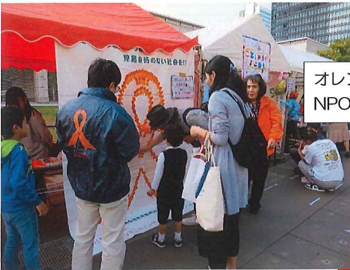
オレンジリボンをあなたの胸に NPO 法人 カンガルーOYAMA