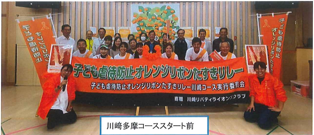
川崎多摩コーススタート前